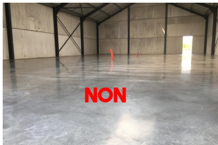
Béton lisse ou ciré